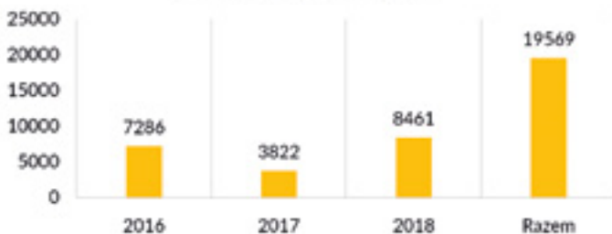
Liczba bezpośrednich i pośrednich odbiorców projektów mikrograntowych

Podkreślenie znaczenia edukacji kulturalnej udało się w większym stopniu w małych miejscowościach, w których wydarzenia związane z projektem skierowane były do ogółu przedstawicieli społeczności lokalnych i cieszyły się zainteresowaniem dużej ich części.